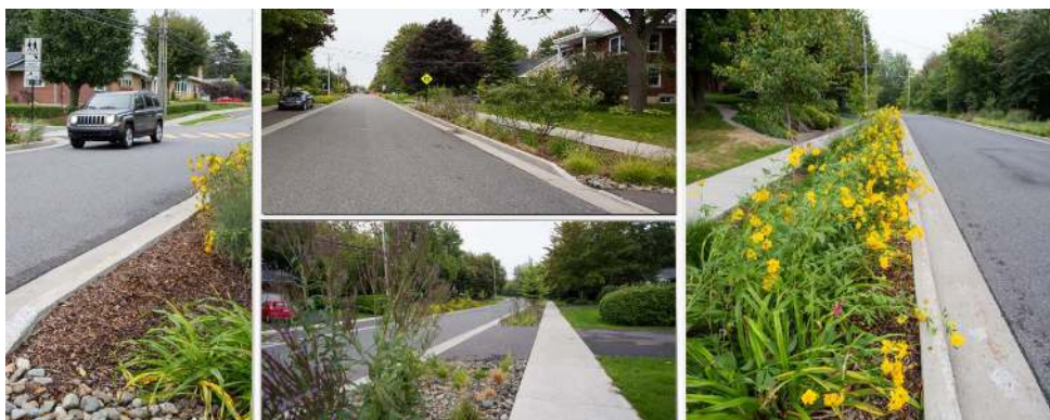
Exemples d'aménagement - Projet réalisé - Source : Ville de Granby

Une noue est une infrastructure urbaine, composée de végétaux, qui permet de remplacer les fossés tout en limitant l'utilisation de conduites pluviales surdimensionnées qui sont moins bénéfiques pour l'environnement et plus coûteuses. On distingue les noues en raison de la présence d'une légère dépression du sol. Chaque noue est indépendante et dotée d'un puisard. Elles sont construites avec un sol particulier permettant de maximiser l'infiltration et la décontamination des eaux pluviales qui peuvent contenir des particules et des polluants. En plus de leur côté esthétique enviable et leur caractère écologique permettant d'inclure la plantation d'arbres et de vivaces, les noues ont un impact positif dans un quartier, car ils réduisent les îlots de chaleur, accroissent les espaces verts et rendent plus conviviaux les parcours pour les piétons et cyclistes.